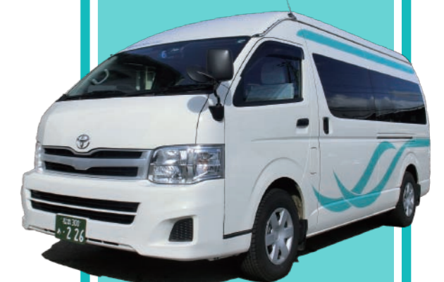
ジャンボ(お客様9人まで)