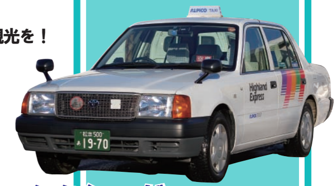
普通車(お客様5人まで)